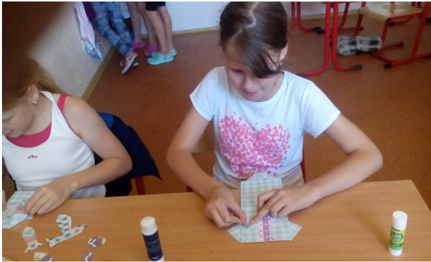
Deti zo Smajlíkovej triedy pripravili pre svojich oteckov malé darčeky.