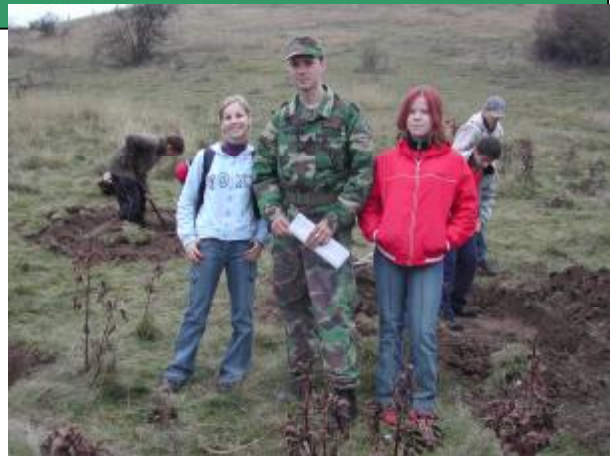
No, nie je fešák?

Vojaci sa s nami rozlúčili niekoľkými svetlicami, ktoré sa nad našimi hlavami vznášali na malých padáčkoch. Opäť sme nastúpili do áut a odviezli sme sa späť do školy, kde na nás čakala najmenej obľúbená teoretická časť. Na naše veľké prekvapenie však bola rovnako zaujímavá ako tá praktická. Dozvedeli sme sa niečo o práci vojakov v teréne, o ich maskovaní, stravovaní a prenocovaní. Tí odvážnejší si dokonca mohli rozobrať a znova poskladať samopal. No a na záver sme mali možnosť porozprávať sa s priamym účastníkom 2. svetovej vojny, ktorý nám ochotne porozprával o jej hrôzach.